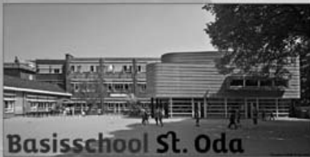
Educatie en ontmoeting

Actieve werkgroepen Informatief buurtblad Nederlandse les opgezet Duivenoverlast weg Leuke buurtactiviteiten Oost West, Brusselsepoort Best