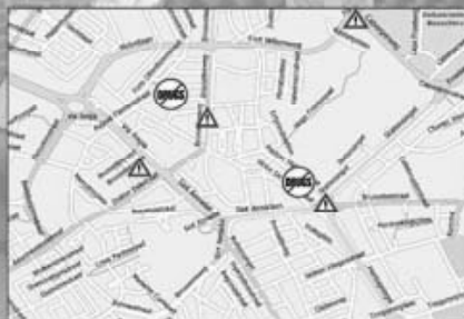
Verkeer en veiligheid

Nieuwe ontmoetingsactiviteiten Schone lucht Veiligheid Toekomst Lambertuskerk