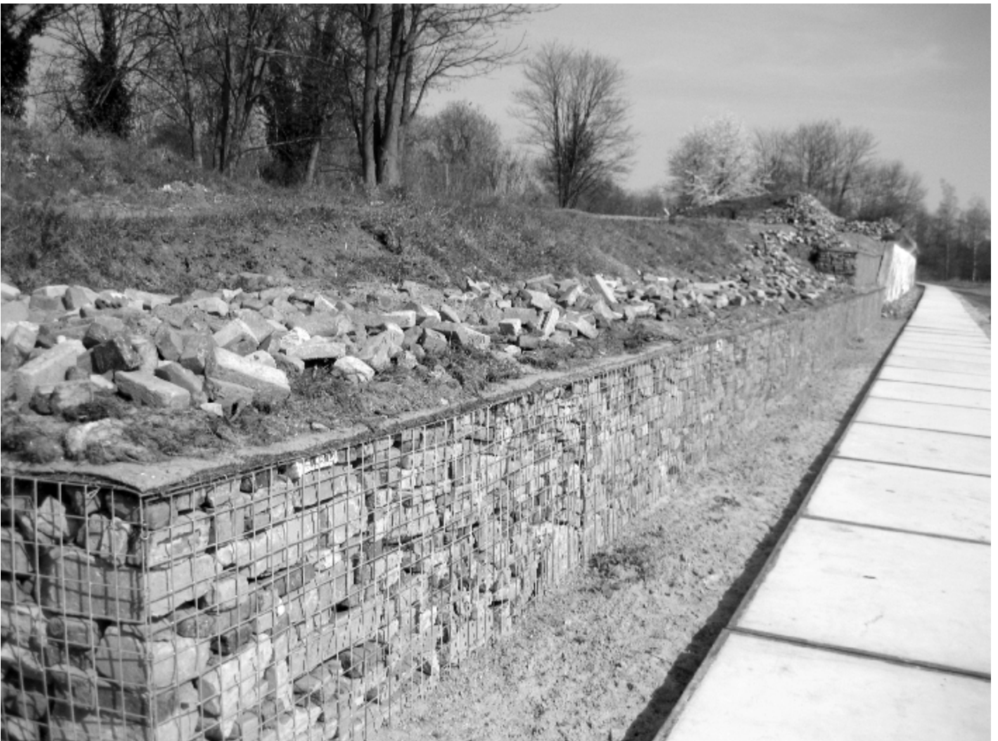
Lage Fronten in ontwikkeling, met nieuw hagedissenbiotoop