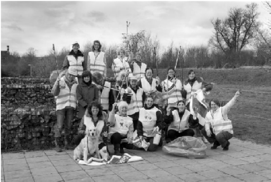
de sjeek en sjoen ploeg