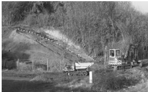
Aanleg nieuwe trap in Hoge Fronten bij Cabergerweg