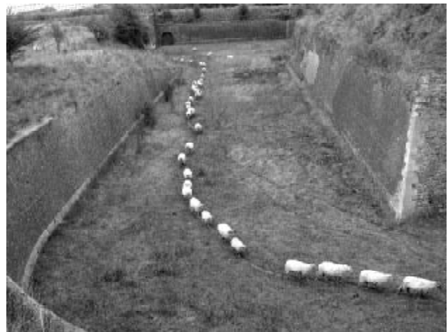
Schape in de Hoge Fronten

Daar onze "problemen" ook de uwe zijn, ik noem bijvoorbeeld; verkeer, sluipverkeer, herinrichting straten, parkeren, grond- en luchtvervuiling, verontreiniging rond het milieuperron, bouwactiviteiten, speelgelegenheid en het onderhoud daarvan, overlast door vandalisme, hangjongeren, drugshandel en gebruik, onveiligheid, sociale contacten enz, zouden we het toejuichen als bij de volgende vergadering in de bovenzaal van Café 1900 aan het Orleansplein een flink aantal belangstellenden in onze (uw) vergadering aanwezig is en hopelijk worden in uw straten ook mensen "buurtactief". Tot ziens op 10 mei om 20:00 uur.