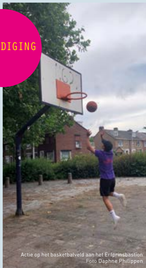
Actie op het basketbalveld aan het Erfprinsbastion