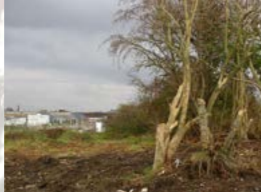
Het verlaten campement