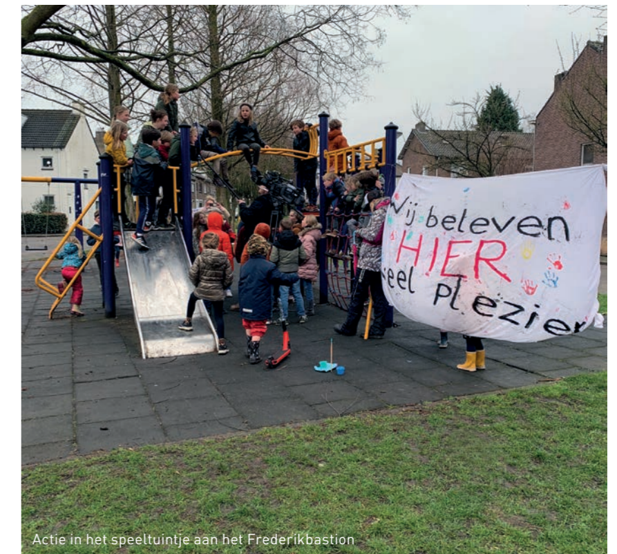
Actie in het speeltuintje aan het Frederikbastion