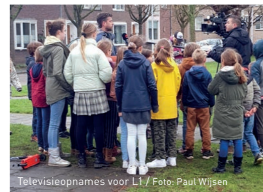
Televisieopnames voor L1