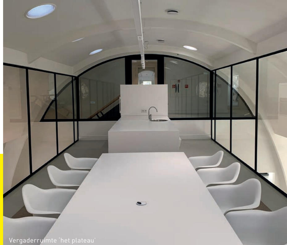
Vergaderruimte 'het plateau'