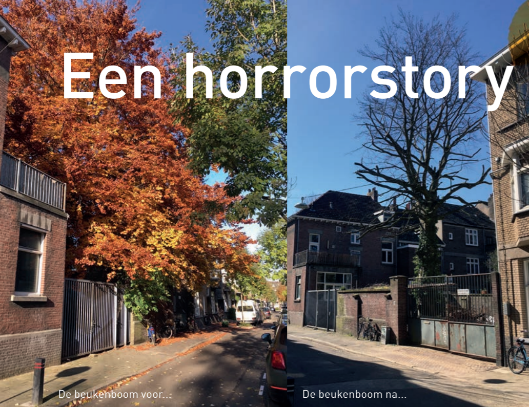
De beukenboom voor...