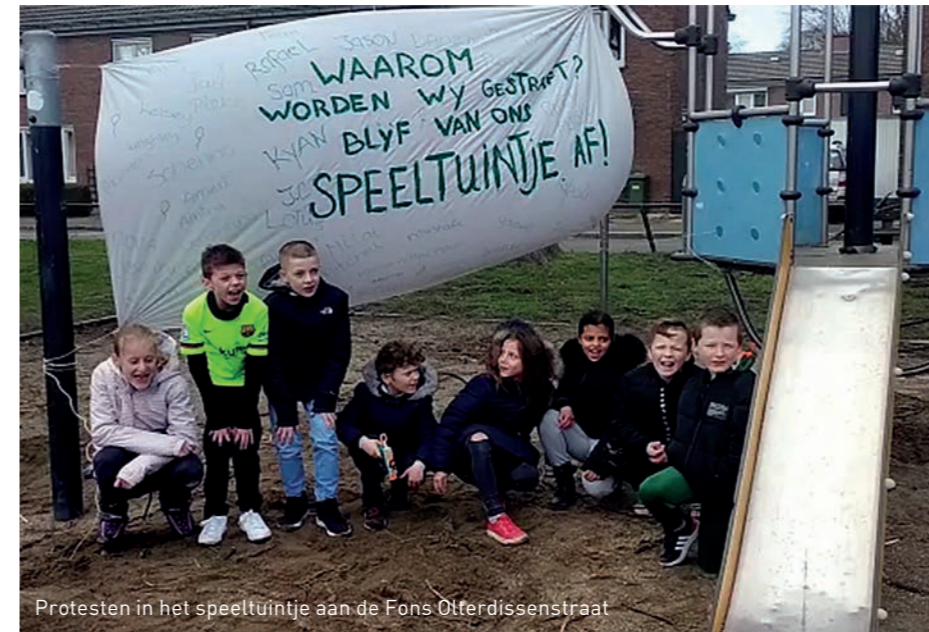
Protesten in het speeltuintje aan de Fons Olterdissenstraat