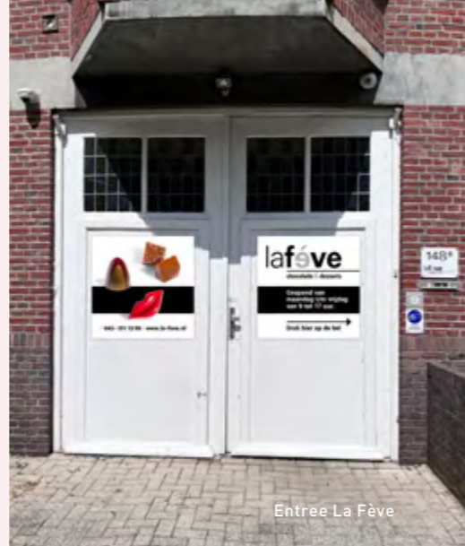
Entree La Fève

Wellicht dat ze in de toekomst uit hun jasje groeien en een nieuwe locatie moeten zoeken, maar tot die tijd ga ik in ieder geval vaker profiteren van dit bedrijf in onze wijk.