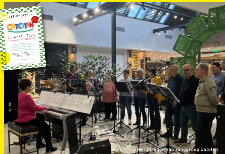
Live optreden van zanggroep Catotsh

Houd onze agenda goed bij op de socials, want wegens succes zullen er nog veel vaker films en optredens in ons buurt-huis vertoond gaan worden!