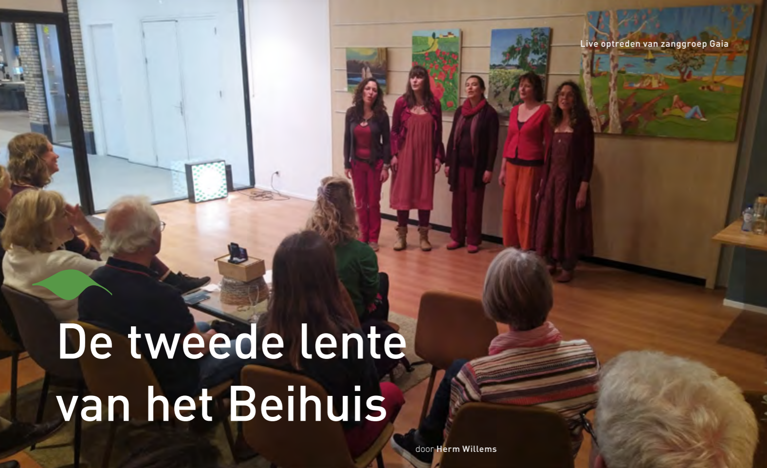
Live optreden van zanggroep Gaia