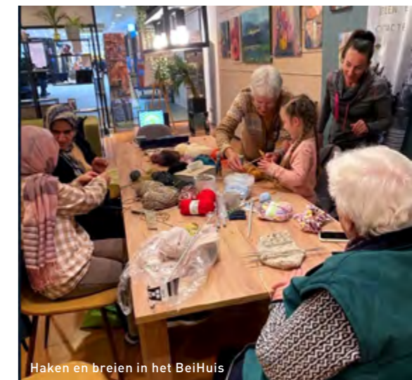
Haken en breien in het BeiHuis

Wilt u mee te helpen om uw eigen omgeving met ons in beeld te brengen? We willen graag van u weten wat u allemaal gelukkig maakt en waar u minder blij van wordt. Dat mag van alles zijn. Uw favoriete bankje in het park, uw grappige (klein)kind dat speelt in de speeltuin, uw hond of kat die in het zonnetje zit, dat donkere hoekje in de buurt waar u niet gelukkig van wordt, noem maar op. Wij vragen u minimaal (maar het mogen er ook veel meer zijn hoor) twee foto's te maken in de buurt. Één van iets dat u gelukkig maakt en één van iets waar u minder gelukkig van wordt. U kunt de foto gewoon met uw telefoon maken. U komt met uw foto naar het Beihuis en vertelt er het verhaal bij aan de gastvrouw of gastheer. Zij helpen u met het opschrij-