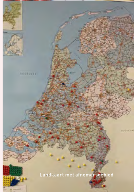
Landkaart met afnemersgebied