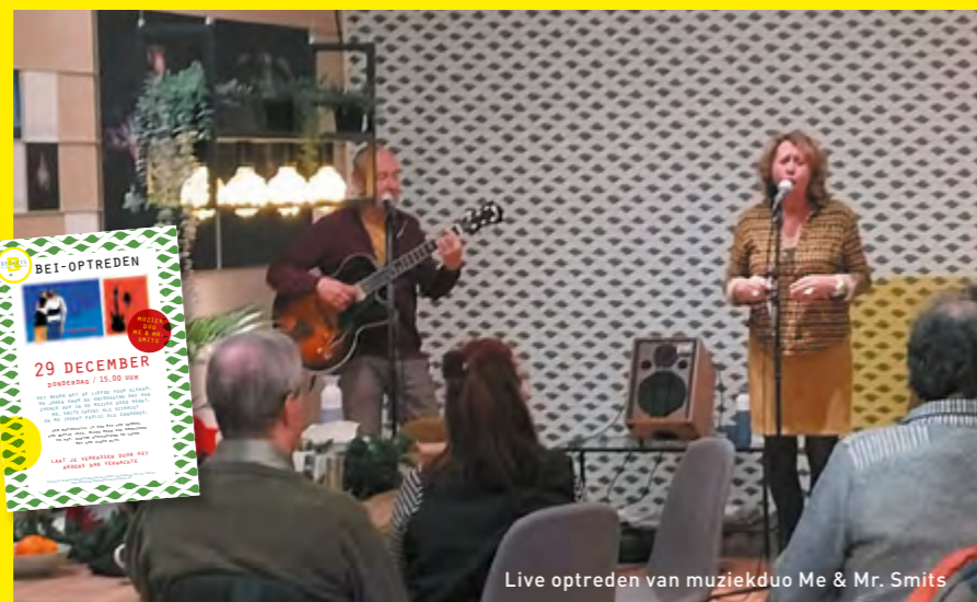
Live optreden van muziekduo Me & Mr. Smits