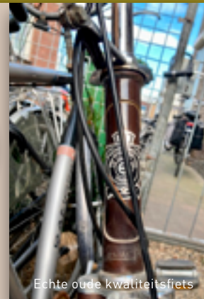
Echte oude kwaliteitsfiets

Paul Le Doux, bijna 77 jaar, gepensioneerd, een kat met 9 levens en (vroeger) een fietsende kilometervreter.