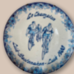
Herinnering deelname Luik-Bastenaken-Luik