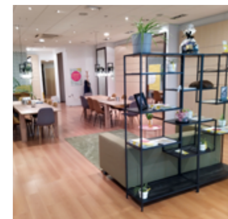
Impressie van het BeiHuis inrichting Nanin Peters vormgeving Daphne Philippen