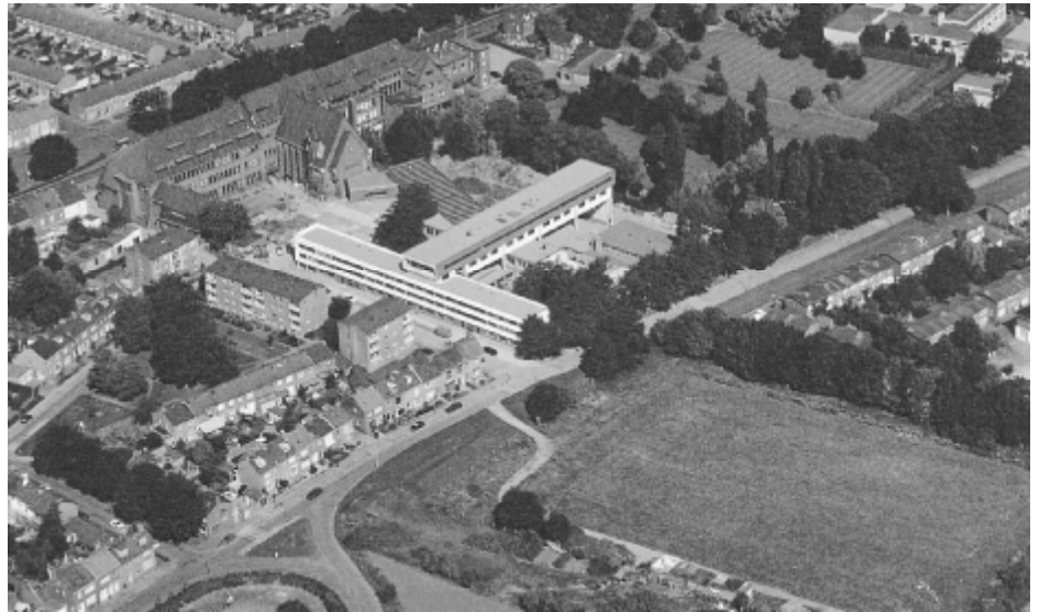
Het complex, net na voltooiing

Waarom was uitbreiding van de hogeschool nodig? Dat had alles te maken met